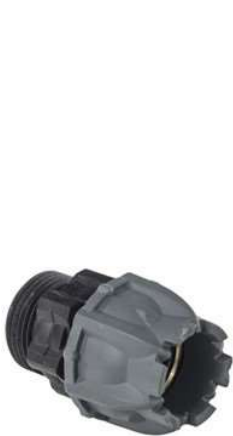
Raccord U-CAN COMPOSIT (US RM)