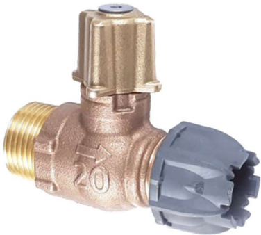
Robinet de prise sur le côté (1819)