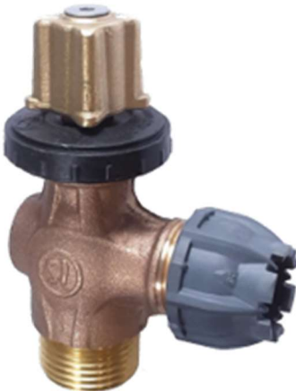
Robinet de prise en charge universel (2009)