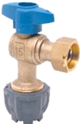
Robinet de compteur (419)